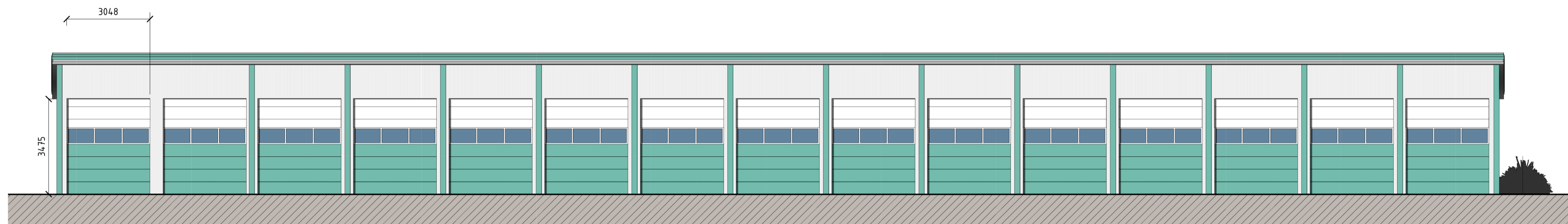
Fasad mot Norr SKALA 1 : 100