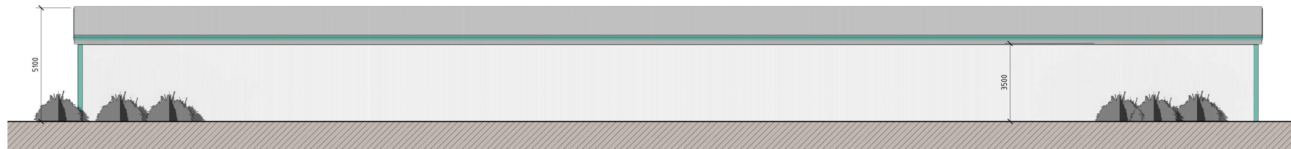
Fasad mot Söder SKALA 1 : 100